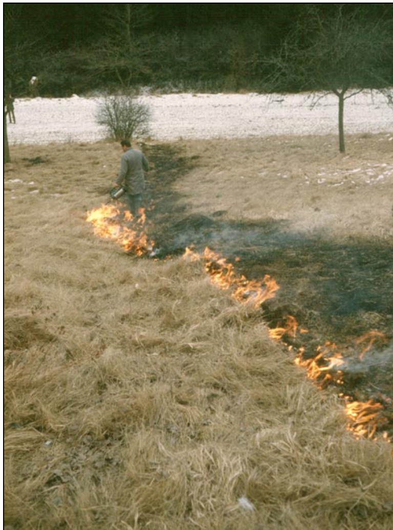
Figure 2. Demonstration prescribed winter fire near Hechingen (February 1978).