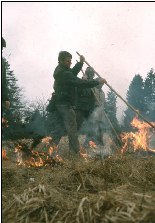
Figure 4. Prescribed burning exercise with representatives of nature conservation authorities and scientists, Hechingen, February 1978.