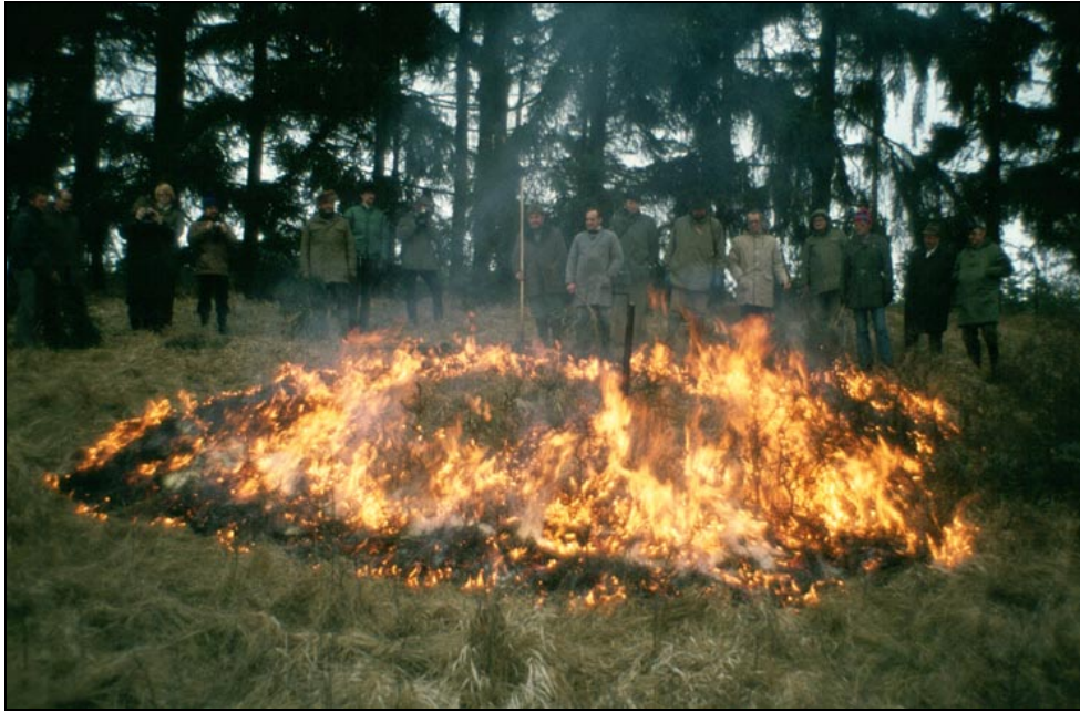
Figure 3. Demonstration of the use of a “hot” ring fire to produce high mortality in successional woody vegetation (Hechingen, February 1978).