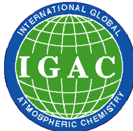
The IGBP International Global Atmospheric Chemistry Project (IGAC) Focus Impact of Biomass Burning on the Atmosphere and Biosphere "Biomass Burning Experiment" (BIBEX)