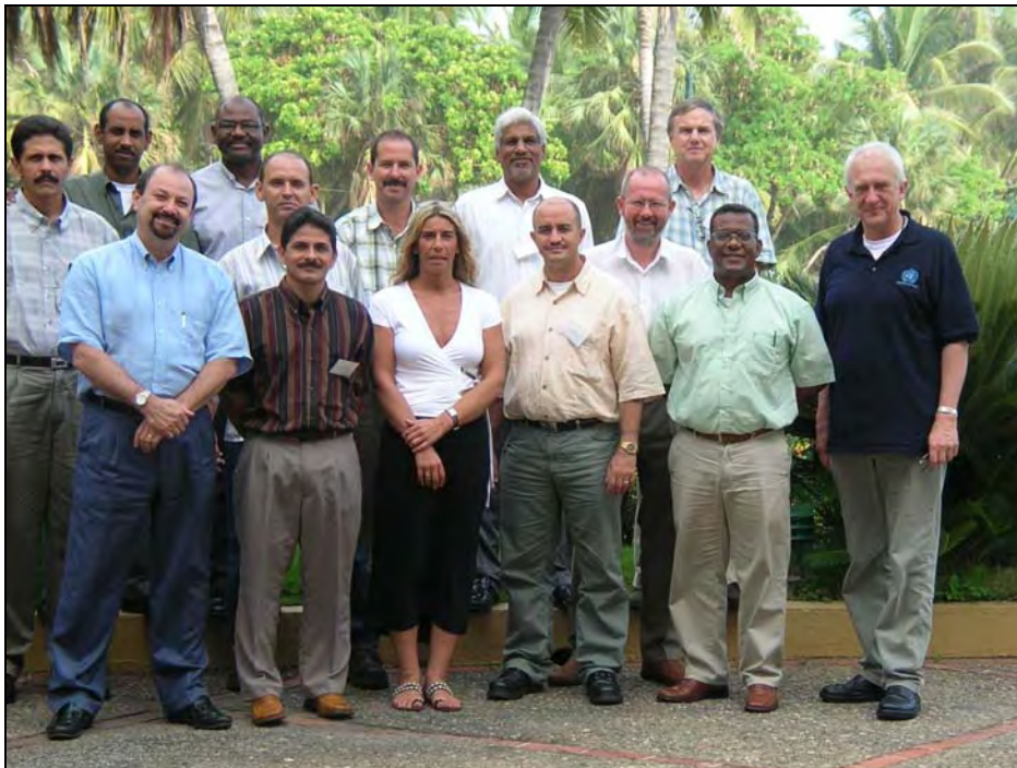
Participantes de Taller Técnico Subregional del Caribe que incluye representantes de Cuba, Jamaica, República Dominicana, y Trinidad & Tobago, así como de la FAO RLC y del GFMC.