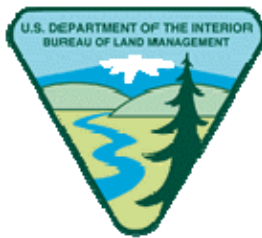
The U.S. Department of the Interior Bureau of Land Management